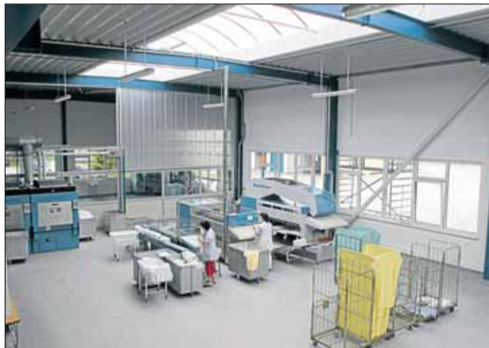
Durch den Anbau konnte viel Platz geschaffen werden.