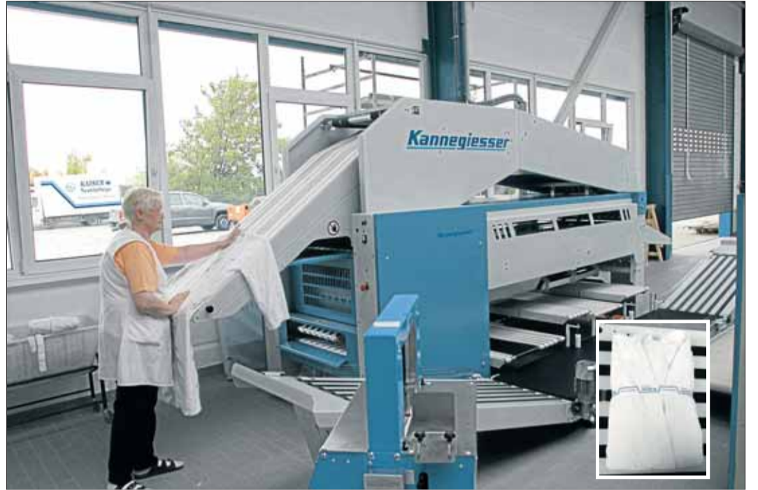
Die neueste Errungenschaft: die Bademantel-Faltmaschine (Ergebnis: kleines Bild).

So wurde auch in der „vergrößerten“ Halle der Platz knapp. Also entschloss sich Wolfgang Kaiser, nochmals das große Rad zu drehen und die Halle zu erweitern. Denn: Mehr Platz bedeutet auch bessere Arbeitsbedingungen für die Mitarbeiter und bessere Bedienbarkeit der Maschinen. Nun sind 500 Quadratmeter neue Fläche hinzugekommen, mit denen die Gesamtsituation wiederum entspannt werden konnte. Nun kommt man sich nicht mehr ins Gehege und hat entsprechend Raum auch für die Wäschewagen. Doch nicht nur die Halle an sich ist neu, Wolfgang Kaiser investierte auch in Neues für den Maschinenpark, wie zum Beispiel energiesparendere Großtrockner.