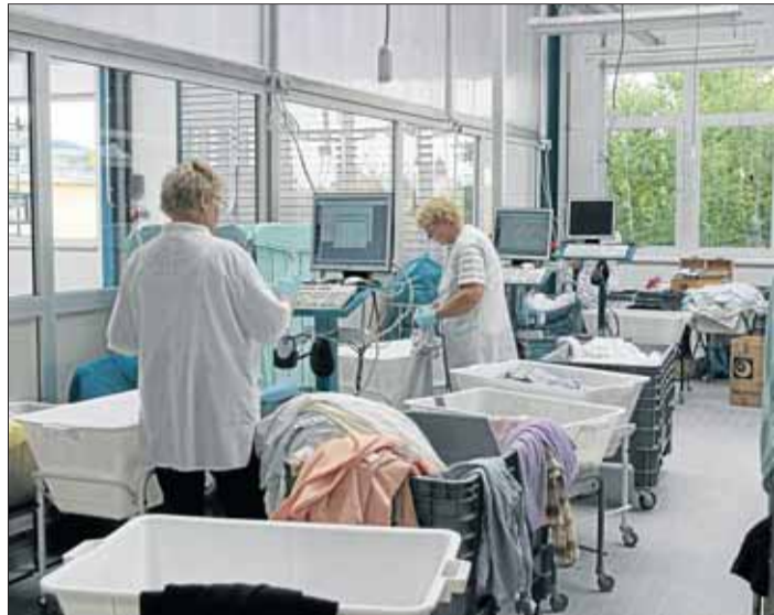
Der neue Bereich, in dem die Wäsche ausgezeichnet wird.