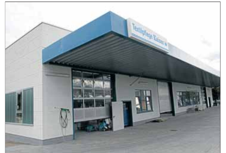
Imposant auch von außen: die neue Halle von Textilpflege Kaiser.